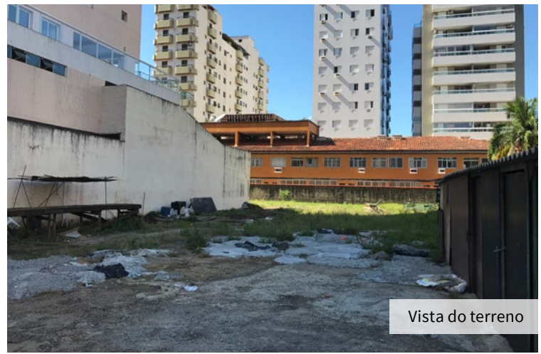
Vista do terreno