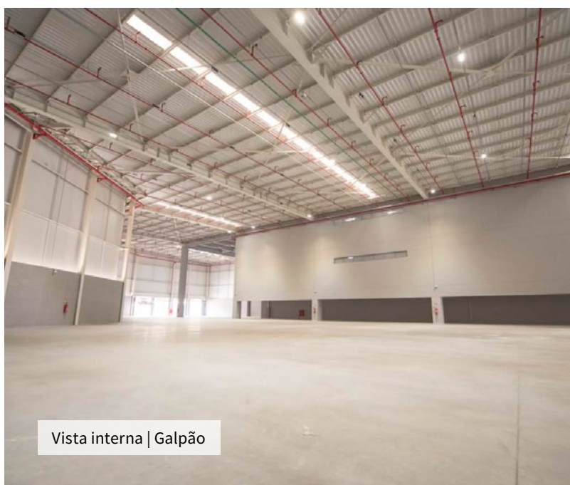
Vista interna | Galpão