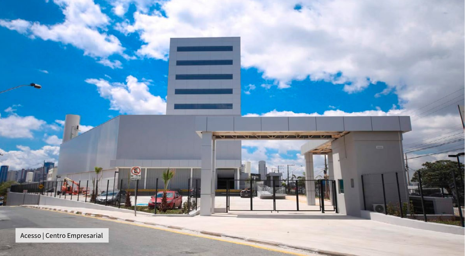
Acesso | Centro Empresarial