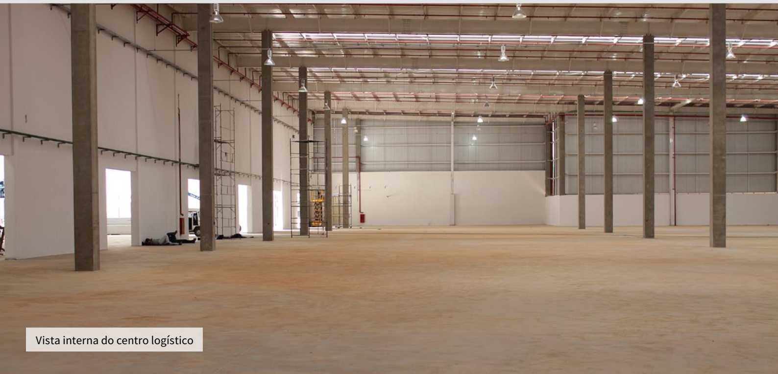
Vista interna do centro logístico