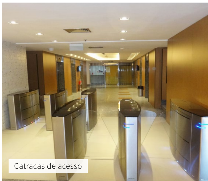
Catracas de acesso