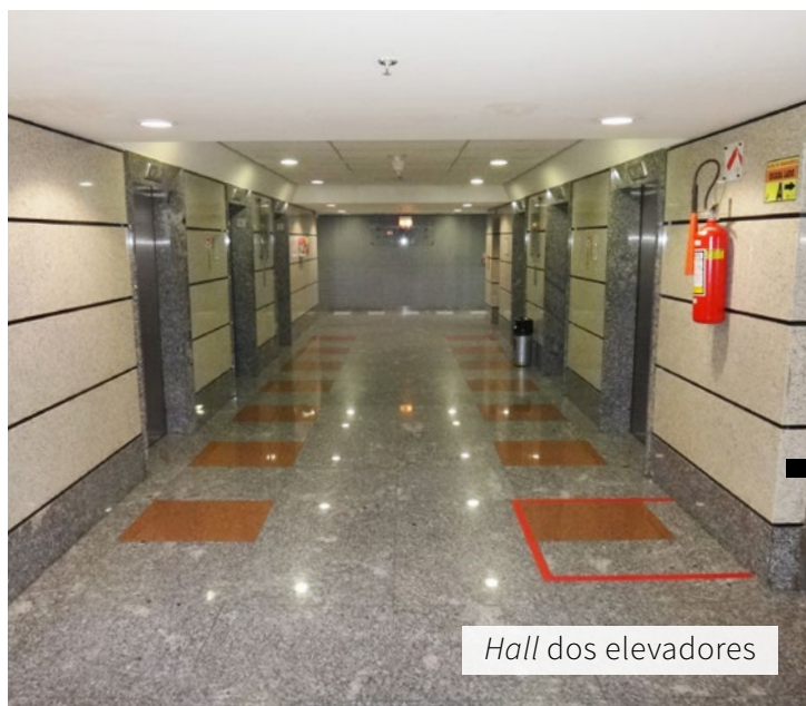
Hall dos elevadores