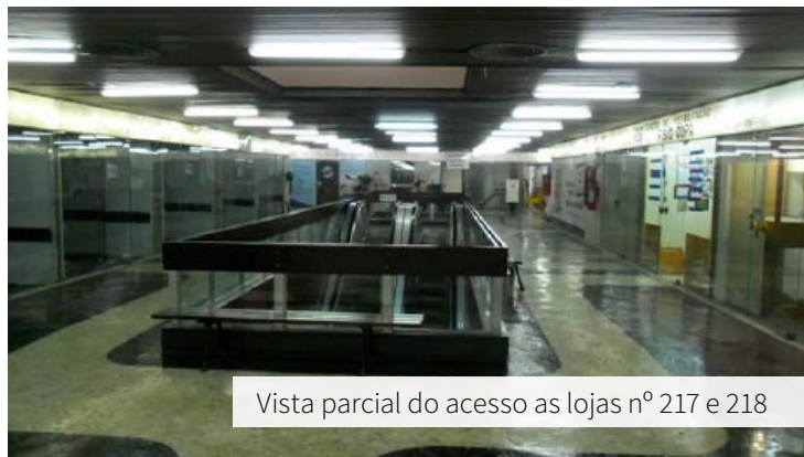
Vista parcial do acesso às lojas nº 217 e 218