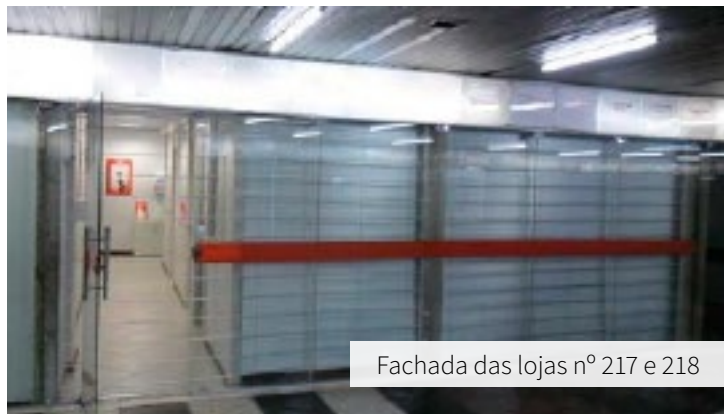
Fachada das lojas nº 217 e 218